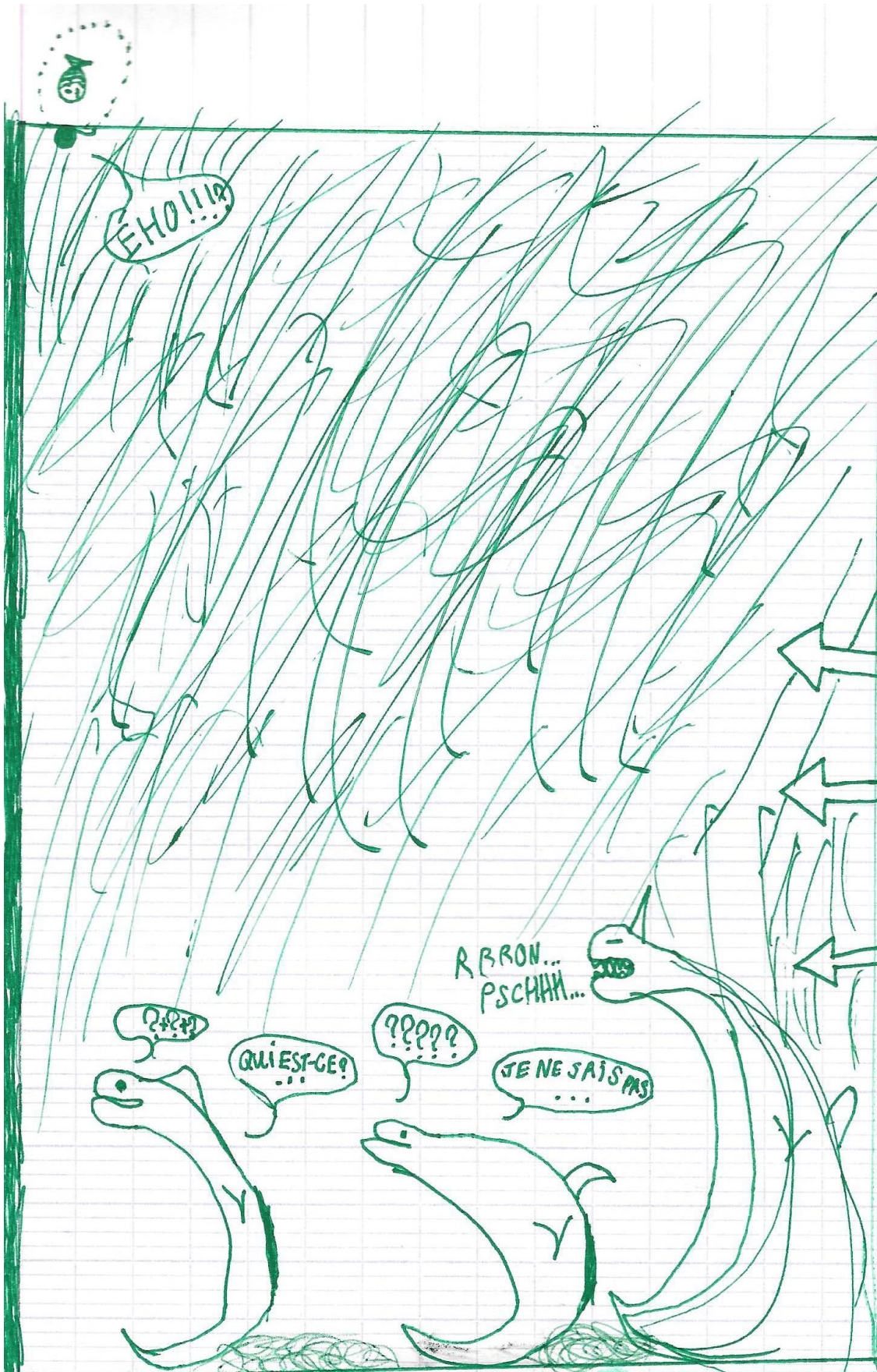
« Quand tout à coup... » page 1